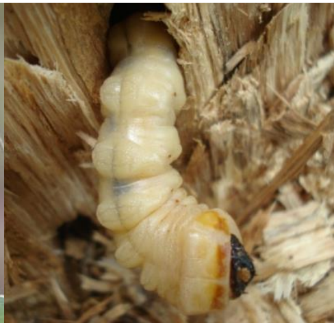
სურ. 15 – მუხის დიდი ხარაბუზას ხოჭო (იმაგო) და მატლი

წინუბნის სატყეოს ტყის მასივებში გამოვლენილი მავნებელ-დაავადებებიდან არ აღნიშნულა მათი მასობრივი გამრავლება და დაზიანების ზღვართანაც არ მისულა მათი რიცხოვნობა, თვალზომური, რეკოგნოსცირებული მაშრუტული კვლევებისა.