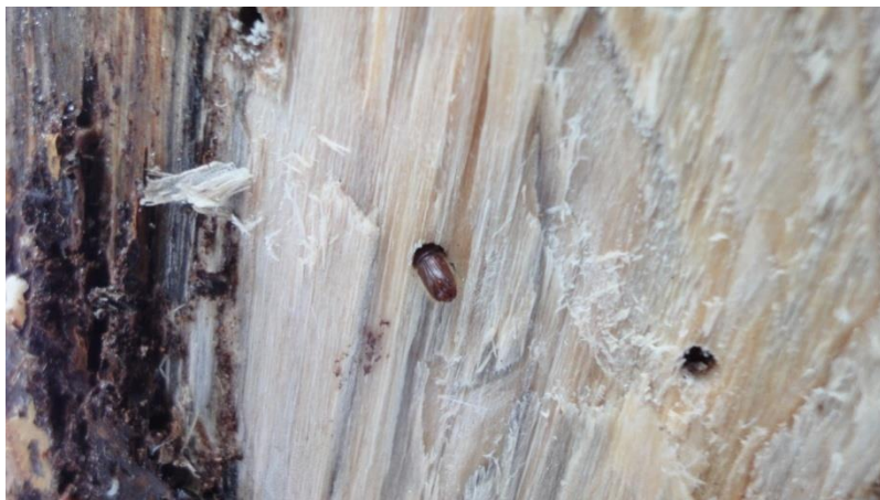
სურ.8- ექვსკბილა ქერქიჭამიას ხოჭო ქერქიჭამიას მიერ დაზიანება