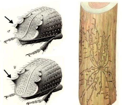
სურ.11 - კენწეროს ქერქიჭამიას ხოჭო დაზიანება