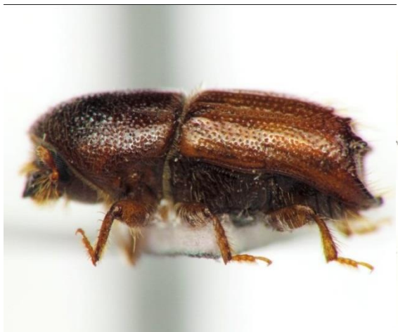
სურ. 10 - ექვსკბილა ქერქიჭამია დაზამთრებისას შედის მერქანში 3-4 სმ.